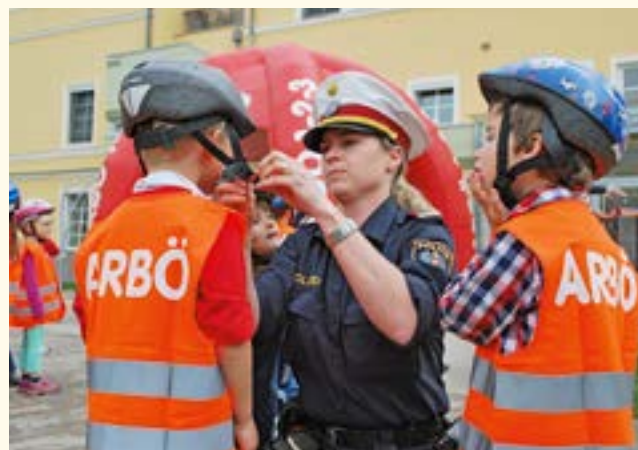
Ohne Helm geht nix...