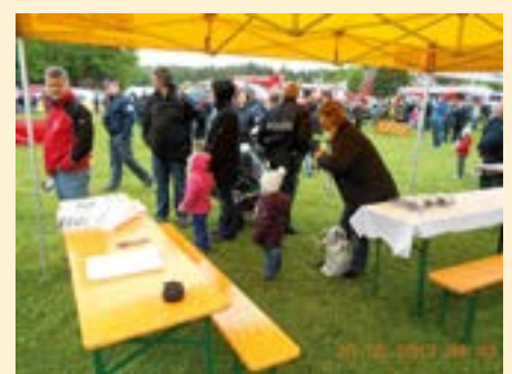
... trotzten dem Regenwetter in St. Kanzian