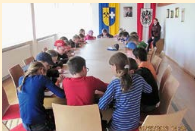
Bei der schriftlichen Prüfung rauchten die Köpfe.