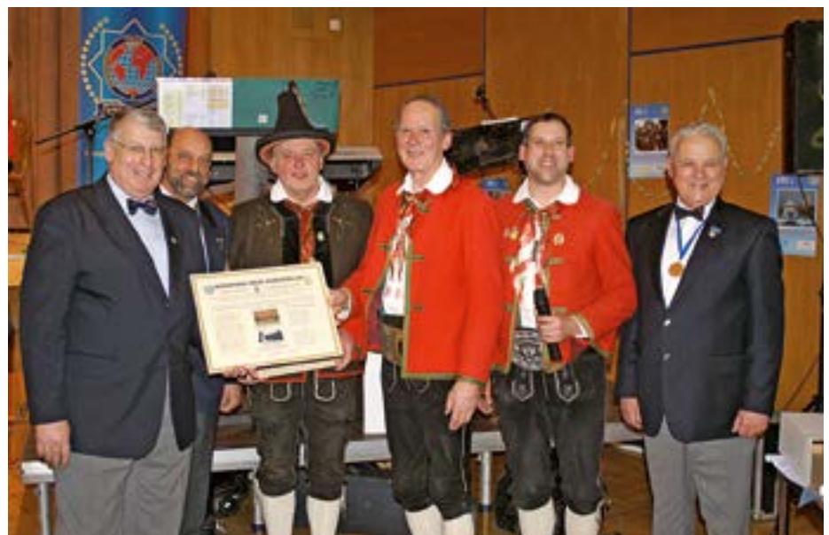
Offizielle Übergabe des IPA-Marsches.