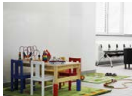
Für die kleinen Besucher wurde im Wartebereich eine Spielecke eingerichtet.