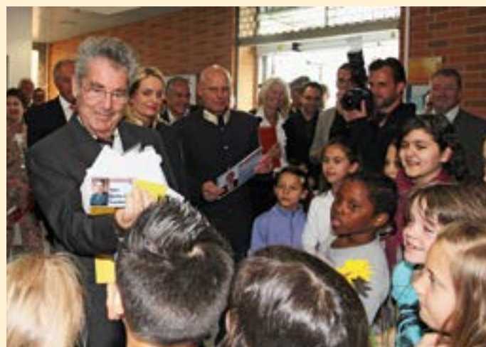
Das Staatsoberhaupt mit den frisch gebackenen Kinderpolizisten.