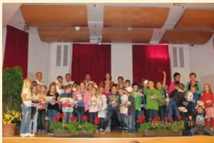
Am Ende gab es noch ein Gruppenfoto.