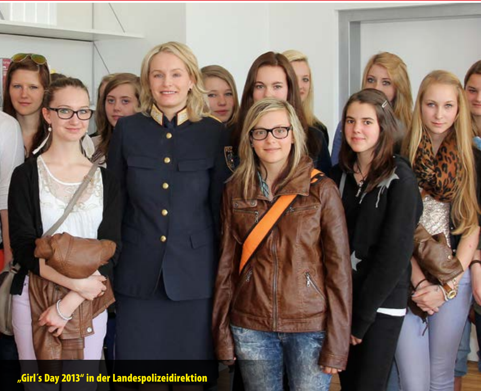
„Girl's Day 2013“ in der Landespolizeidirektion

DAS INFO-MAGAZIN DER LANDESPOLIZEIDIREKTION