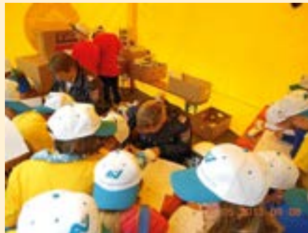
Ansturm beim KiPo-Zelt.

Am 6. Mai 2013, zwischen 09:00 Uhr und 13:30 Uhr, fand trotz Regen die „Kindersicherheitsolympiade 2013“ als erste dieser Veranstaltungen im Bezirk Völkermarkt statt.