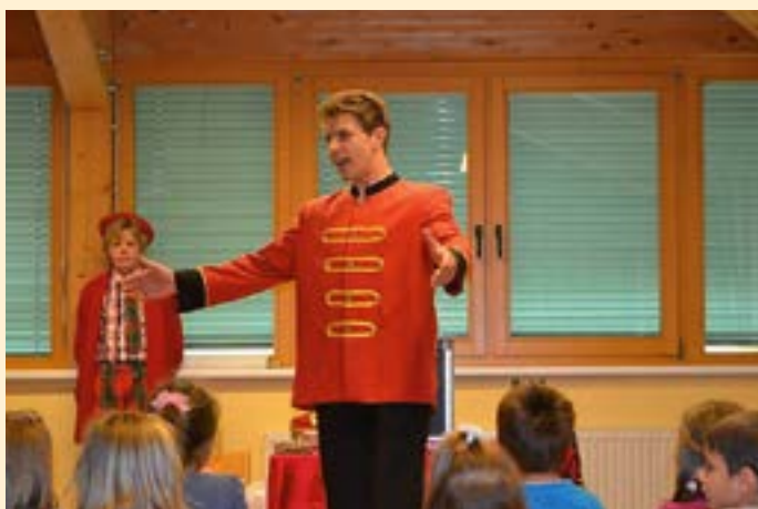
Begeistert verfolgten die Kleinen das Programm des Zirkus Dimitri.