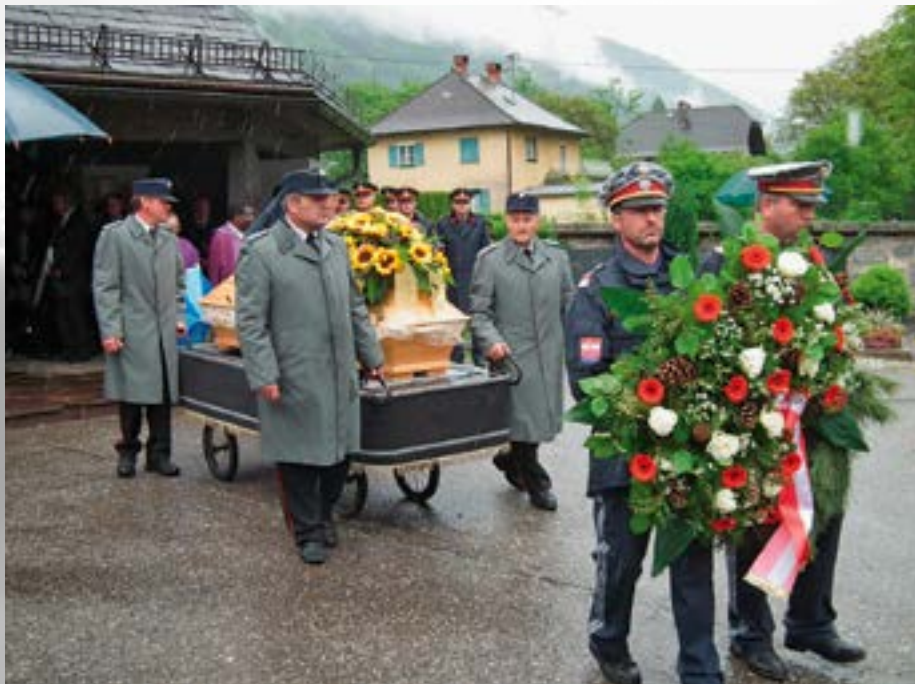
Die Kameraden der FF Kolbnitz begleiteten ihr langjähriges Unterstützungsmitglied auf seinem letzten Weg.