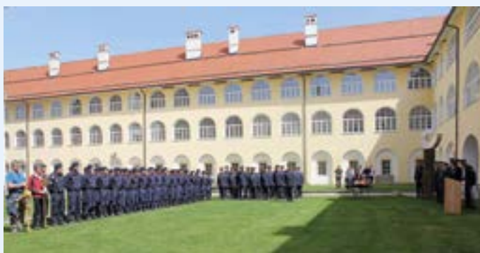
Beim anschließenden Totengedenken ...