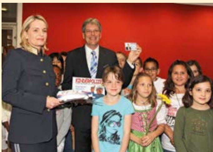
Auch Landeshauptmann Dr. Peter Kaiser präsentierte seinen Ausweis den Fotografen