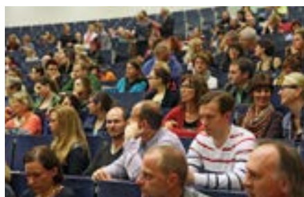
Rund 300 Zuhörerinnen und Zuhörer ...

Wie gebannt folgten die über 300 Zuhörer dem Vortragenden, als er über die Hintergründe des Amoklaufs von Winnenden oder über Täterprofile der beteiligten Personen bei dem Massaker von Srebrenica sprach und sie als bis dahin großteils „unauffällig“ beschrieb.