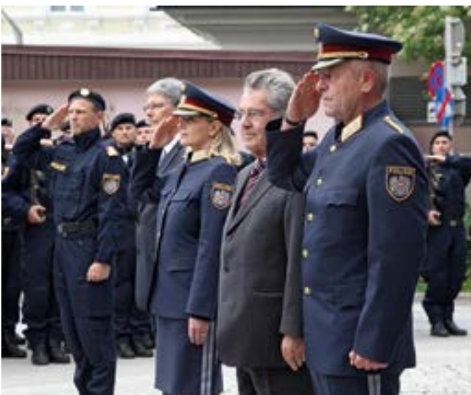
Die Führungsspitze der LPD Kärnten mit Bundespräsident Dr. Heinz Fischer.