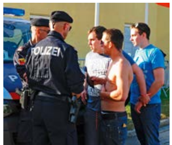
Einsatztaktik: Dialog, Deeskalation, aber auch konsequentes Durchgreifen im Bedarfsfall.