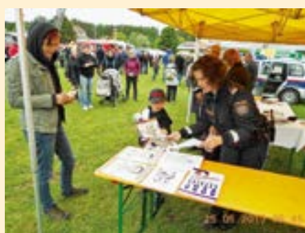
Nach der Prüfung gibt's die Belohnung.