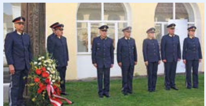
... wurde den Verstorbenen der Polizei gedacht.