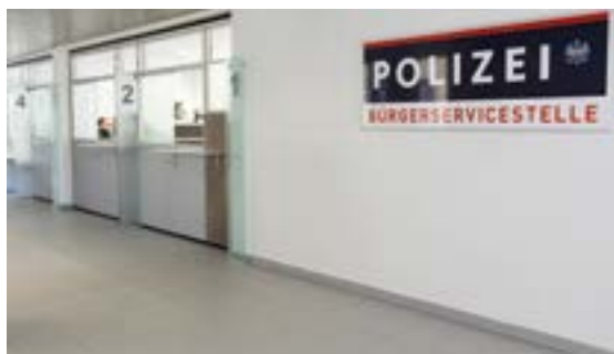
Die frisch renovierten Räumlichkeiten präsentieren sich hell und freundlich.

Telefonisch ist die Bürgerservicestelle unter der Nummer 059 133/20-6666 erreichbar