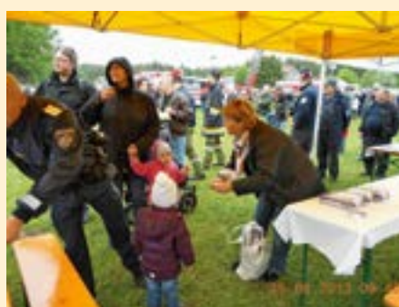
Zahlreiche Besucher ...