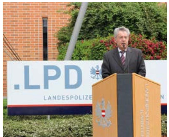
In seiner Rede lobte der Bundespräsident das Engagement der Polizistinnen und Polizisten in Kärnten.